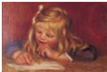
Coco lisant (MNR 1004) Paris, musée d'Orsay, déposé au Musée Renoir de Cagnes-sur-Mer 1995.

Rendez-vous devant l'entrée du musée Renoir.